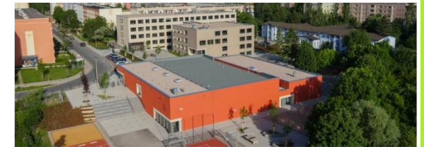
Schulcampus „Am Paradies“